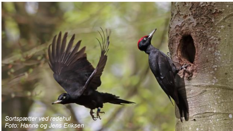
Sortspætter ved redehul