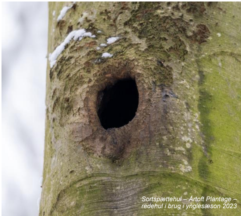
Sortspættehul – Årtoft Plantage – redehul i brug i ynglesæson 2023

Strategien kunne være at gennemvandre skovparcellerne og se efter spættehuller eller tegn i skov-bunden på aktivitet. Der er ikke myretuer i Nørreskoven, men træstubbe og væltede døde træer, der kunne indeholde fødeemner og vise tegn på spætteaktivitet, som kan være ret voldsom.