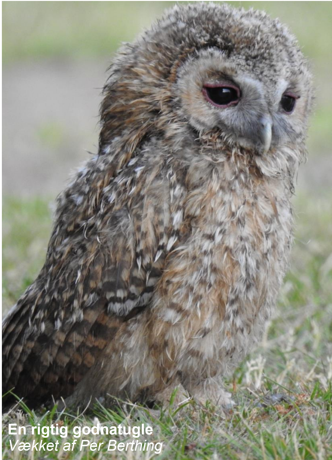
En rigtig godnatugle Vækket af Per Berthing