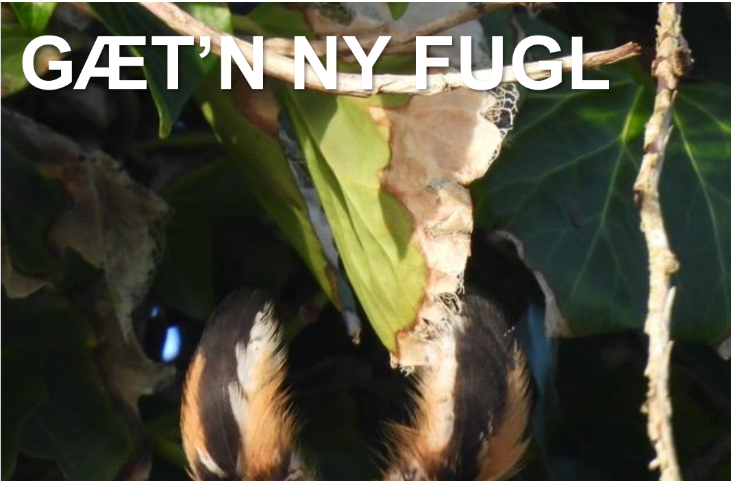
Foto: Lars Møller Andersen (ja naun stoe fotograf hæ æ fåmand alle væt)