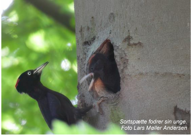
Sortspætte fodrer sin unge.

Anders kunne oplyse os, at vi skulle fokusere på beplantninger ældre end 100 år og det reducerede søgearealet yderligere fra 740 Ha til ca. 114 Ha. Vi måtte stadig konstatere: Der er mange bøgetræer i den skov.