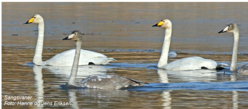
Sangsvaner