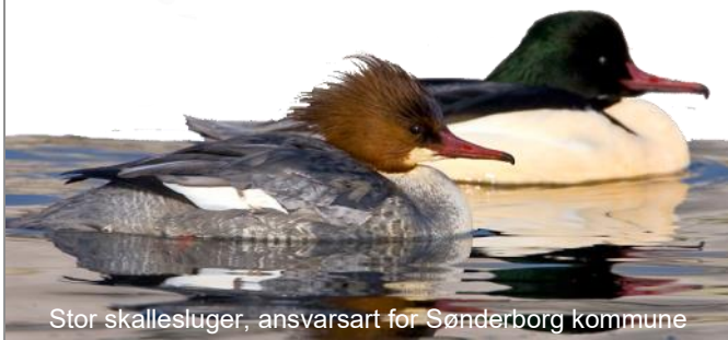
Stor skallesluger, ansvarsart for Sønderborg kommune

* Ikke-medlemmer kan se ændringer på www.oasweb.dk